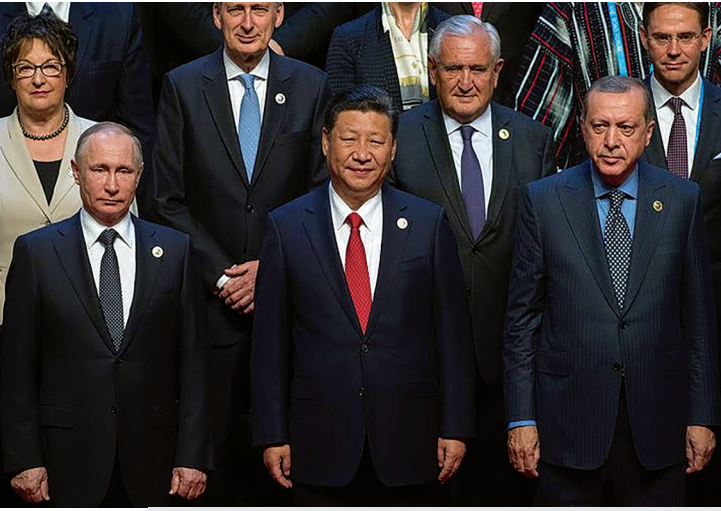
2017 yılında Pekin'de düzenlenen Kuşak ve Yol Forumu.

porda; “dünyanın ağırlık merkezinin değişmekte olduğundan ve Türkiye’nin ihtiyaçlarını koridor ve kutuplardan oluşan karmaşık bir ağ üzerinde haritalandırmanın öneminden” bahsedilmektedir (DEİK, 2019: 14). Kuşak ve Yol Girişimi’nde aktif olarak rol almanın; “Türk diplomasisine bölgede ve dünyada daha geniş bir hareket alanı kazandıracığı” ifade edilmektedir (DEİK, 2019: 22).