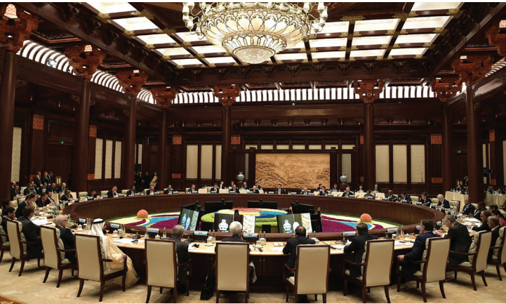
Pekin'de düzenlenen İkinci Kuşak ve Yol Forumu'nda Yuvarlak Masa Liderler Zirvesi, Nisan 2019.

Geçtiğimiz altı yıl boyunca Çin, KYG ülkeleriyle 82 denizaşırı işbirliği bölgesi oluşturdu. Çin, 2 milyar doların üzerinde vergi ödeyerek ve yaklaşık 300 bin istihdam yaratarak işbirliği kapsamında yatırım yapılan ülkelere katkı sağladı. Bu yatırımlar sayesinde, muhtelif ülkelerin halklarına; daha uygun yaşam koşulları, daha elverişli iş ortamları ile çeşitli gelişme olanakları da temin edilmiştir. KYG sayesinde bazı ülkelerde ilk otoyollar veya modern demiryolları inşa edilirken, bazı ülkelerde de otomotiv endüstrisi kurulmuş veya sürgit olmuş elektrik enerjisi açıkları ve kesintileri giderilmiştir. KYG kapsamında gerçekleştirilen işbirliğinin meyveleri olarak, çeşitli ülkelerde insanların yaşam standartlarının belirgin bir şekilde iyileştiği görülüyor. Yürütülen işbirliği projeleri, BM 2030 Sürdürülebilir Kalkınma Gündemi'nde yer alan hedeflerin gerçekleşmesine önemli ölçüde katkıda bulunmaktadır. Dünya Bankası'na göre KYG, küresel yoksulluğun giderilmesi sürecini ivmelendirmektedir.