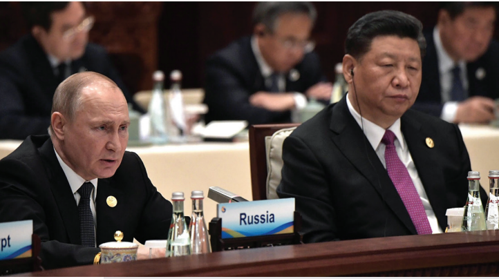
Pekin'de düzenlenen İkinci Kuşak ve Yol Forumu'ndaki Yuvarlak Masa Liderler Zirvesi'nin ilk oturumunda Vladimir Putin ve Xi Jinping, Nisan 2019