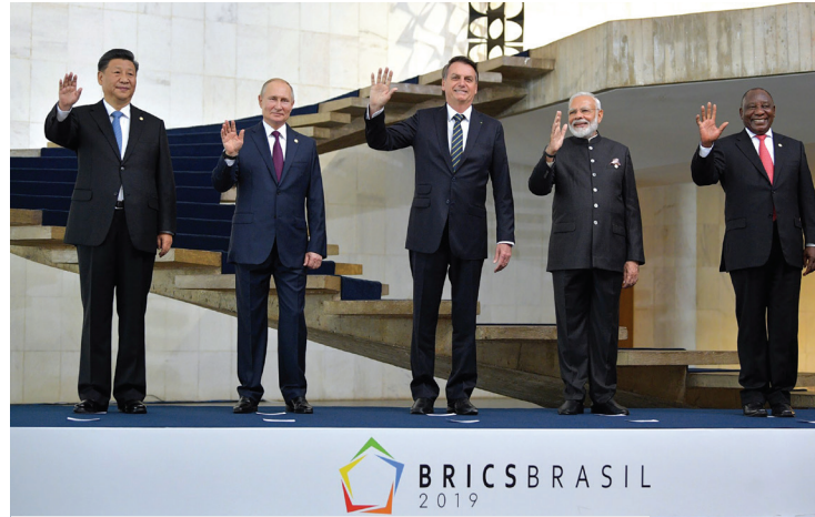
2019'da beş üye ülkenin devlet veya hükümet başkanlarının katıldığı 11. BRICS zirvesi.

BRICS, küresel yönetimde yenilenmenin tek bayraktarı değildir. Benzer doğrultuda ŞİÖ; askeri ve ekonomik alanların yanı sıra enerji ve eğitimi ilgilendiren alanlardaki işbirliğini bir arada yürütecek bir bölgesel yönetim anlayışının başını çekmektedir. ŞİÖ, Amerikan merkezli dünya düzeninin başarısızlıklarından yola çıkarak kendine ait önceliklerini "Üç Kötülük" başlığıyla özetler: Terörizm, ayrılıkçılık ve dini aşırıcılık. ŞİÖ; küresel yönetimi onarma adına, demokrasi, insan hakları ve ulus üstüçülük gibi değerlerin Batı tarafından yayımları ve müdahaleci amaçlar doğrultusunda istismar edilmesine karşı "Şanghay Ruhunu" öne sürer. Şanghay Ruhunu; karşılıklı güven, karşılıklı kazanç, eşitlik, istisare, kültürel çeşitlik ve ulusal egemenliğe saygı ile ortak kalkınma amacı gibi adil küresel yönetimi öne çıkaran temel ilkelerde anlamını bulur (İ1). ŞİÖ,