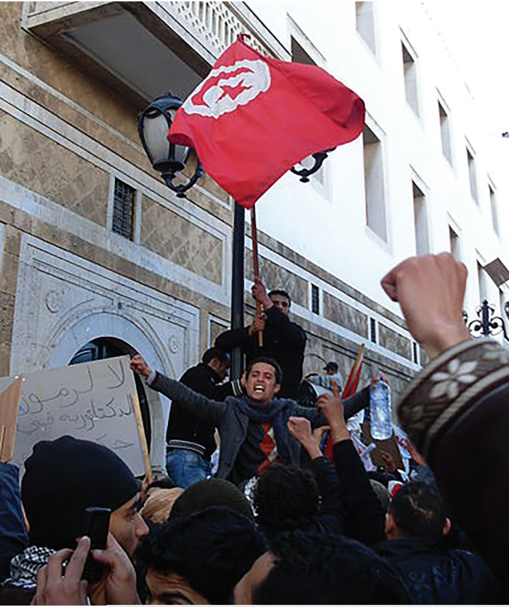
Tunus devrimi sırasında hükümet karşıtı gösteri 23 Ocak 2011.

Bernard Lewis'in dediği gibi, "Osmanlılar kendilerinden öncekilerin çalışmaları üzerine ayakta kalabilen bir siyasi yapı ve işleyen bir siyasi düzen kurmuşlardı. Ayrıca gayet iyi anlaşılabilir bir politik kültür yaratmışlardı; bunda yer alan her grup ve birey, durumlarını, sınırlarını, güçlerini, en önemlisi de ne alıp vereceklerini ve kimden alıp kime vereceklerini çok iyi biliyordu. Osmanlı düzeni zor zamanlarda da birçok güçlüğe rağmen işlemeye devam ediyordu. Hıristiyan tebaasının çoğunluğunun onayını ve bağlılığını kaybetmiş olsa da Müslüman halkın çoğunluğu meşruluğunu kabul etmeye devam ediyordu. Osmanlı düzeni son yıllarda kendine gelmeye ve düzelmeye başlamıştı ama Birinci Dünya Savaşı'na girilmesi ve imparatorluğun sonunun gelmesiyle bu gelişme kesilmişti." (Lewis, 1995, s. 342)