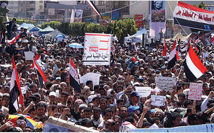
Sana Üniversitesi'ne yürüyen onbinlerce Yemenli gösterici, 1 Mart 2011.

Bu karmaşa ve çatışmanın yarattığı siyasi ortamda Irak ve Şam İslam Devleti (İŞİD) gibi yapılar ortaya çıktı ve tüm dünyadan çok sayıda genci örgütledi. İŞİD, Kuzey Irak ve Suriye'de toprakların büyük bölümünü işgal etti ve petrol satarak büyük miktarda finansal kaynak oluşturdu. Rusya'nın Suriye'ye yönelik güçlü müdahalesi ile birlikte, İŞİD ile mücadele uluslararası toplumun temel endişesi haline gelmiştir. Şimdiye kadar, aşırı İslami güçler zayıflamıştır. Ancak şu anda, Türkiye'nin Kuzey Suriye'deki güçlü varlığı ile Ortadoğu'nun geleceği hâlâ yeni zorluklarla karşı karşıyadır.