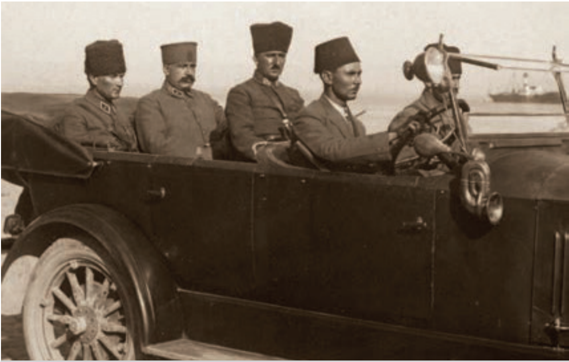
Mustafa Kemal'in, Genelkurmay Başkanı Fevzi (ÇAKMAK) Paşa ile İzmir'e gelişi, İzmir, 10 Eylül 1922.

Fransız Devrimi sonrası ideolojik bağlamda tüm dünyayı etkileyen milliyetçilik hareketleriyle başlayan isyanlar, 19.yüzyıl ve 20.yüzyıl başlarında Balkanlarda yalnızca mikro boyutta ulus devletlerin kuruluşuna yola açmakla kalmayacak, daha ileri siyasal süreçlerde bu devletleri doğrudan Batı emperyalizminin askeri ve siyasal enstrümanı haline getirecektir. Bu bakımdan Osmanlı Devleti sınırları içinde olan ve 1821 yılında başlayan Yunan İsyanı'ndan, 1912-1913 yıllarındaki Balkan Harbi'ne kadar devletin Balkanlardaki zayıflaması ve toprak kayıplarında, Yunanlılar başat role sahipti. 5 Ekim 1821'de, Mora'da başlayan ayaklanmada Türk, Arnavut, Yahudi ve diğer uyruklardan Tripolitsa kentindeki katliamlarda 12,000 kişi öldürülmüştü. 1822 yazına kadar Rum ayaklanması sonucu bu milletlerden ölenlerin sayısı 50,000'i bulmuştu. (Sonyel, 2014: 208-209).