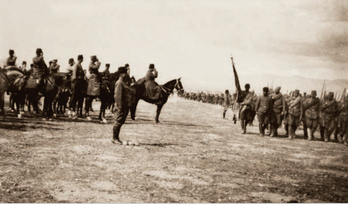
Mustafa Kemal, Batı Cephesi Komutanı İsmet (İNÖNÜ) Paşa ile Ilgın Manevraları'nda, Ilgın, Konya, 1 Nisan 1922. (Genel Kurmay Başkanlığı arşivinden)

Batı Anadolu'da başta Reddi İlhak Cemiyeti öncülüğünde başlayan Kuvayı Milliye Hareketi direnişleri ve sonrasında ise düzenli orduya geçişle birlikte çok kritik değerinde olan 1. ve 2. İnönü zaferleriyle önemli başarılar elde edilmiştir. Yunanlıların adeta bütün kuvvetleriyle saldırıları sonucu Türk kuvvetlerinde geri çekilişler yaşanmış fakat nihayet Sakarya Savaşı ve Büyük Taarruz'la Yunan işgali sonlandırılmıştır.