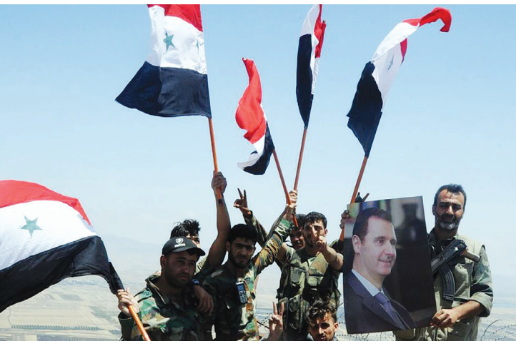
Suriyeli askerler, Suriye'nin Daraa eyaletinin kuzeybatı kırsalındaki Tal al-Harrah'da, Suriye, 19 Temmuz 2018.

isteyen küresel ve bölgesel güçler açısından eşit derecede önemlidir (O'Sullivan, 2018; Prashad, 2012). Libya, Ortadoğu, Afrika ve Avrupa'yı birbirine bağlayan stratejik bir köprü teşkil eder (Erdağ, 2017; Wehrey, 2018). Yine bu ülke, Afrika'nın en büyük petrol rezervlerine ve beşinci en büyük doğal gaz rezervlerine sahiptir. Bu arada Libya'nın petrolü, düşük üretim maliyeti, düşük sülfür içeriği ve Avrupa'ya yakınlığı nedeniyle "tatlı hammadde" olarak adlandırılmaktadır. Libya'nın denetimi, yeni keşfedilen doğal gaz ve petrol kaynakları nedeniyle jeopolitik rekabetin tırmandığı Levant'ın tamamını kontrol etmek için de çok önemlidir. Libya'nın bulunduğu Akdeniz bölgesi, küresel deniz ticaretinin sadece üçte birine ev sahipliği yapmakla kalmaz, aynı zamanda dünyadaki en bol doğal gaz kaynaklarından birine de sahiptir. Ayrıca Libya, Afrika'nın Avrupa'ya ve bölgedeki diğer Orta Doğu ülkelerine yönelik göçmen akışları dahilinde hâkim konumdadır (O'Sullivan, 2018; Prashad, 2012). Libya'yı kontrol etmek, aynı zamanda bölge ülkelerine karşı stratejik bir baskı aracı olarak kullanılabilir olan göç akışlarını kontrol etmek anlamına da gelir.