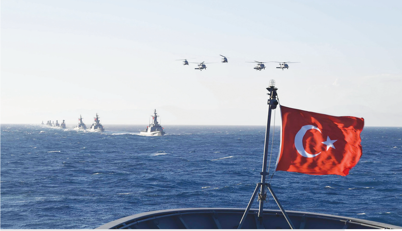
27 Şubat-3 Mart tarihlerinde yapılan 'Mavi Vatan-2019' hava-deniz tatbikatı.

ilişkileri her seviyede yükseliyor. Suriye'de Astana süreci Cenevre sürecinin önüne geçebiliyor. Spykman'ın kenar kuşağındaki (Spykman, 1944) devletler yüzlerini Asya'ya dönüyor.