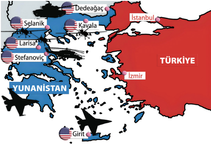
ABD'nin Yunanistan'daki askeri yığınakları. (BRIQ, 2022)

Karada kazanılan Kurtuluş Savaşı sonrasında, Lozan'a donanmasız 9 olarak giden Türkiye Büyük Millet Meclisi (TBMM), 1923 Lozan Barış Antlaşması'nda Mavi Vatan'ı üzerinde bulunan ve Yunan işgaline uğramış Boğazönü Adaları'nın çoğu ile Saruhan Adaları'nı askersizleştirilmek koşuluyla Yunanistan'a bırakmak zorunda kalmıştır. Ayrıca, Lozan'da İtalyan işgalindeki Menteşe Adaları da İtalyanlara bırakılmış; II. Dünya Savaşı'nın kaybedenleri arasındaki İtalya da, 1947 Paris Barış Antlaşması'nı imzalayarak 1923 Lozan Barış Antlaşması'na aykırı olarak Menteşe Adaları'nı Türkiye yerine -askersizleştirme koşuluyla- Yunanistan'a bırakmıştır.