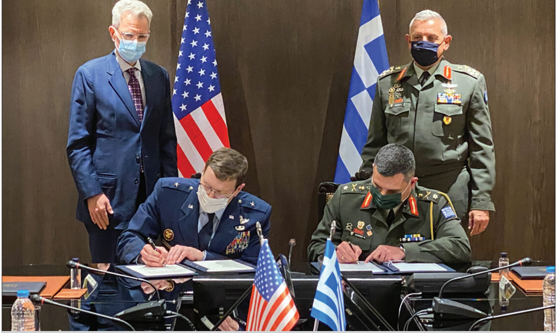
ABD-Yunanistan Karşılıklı Savunma İşbirliği Anlaşması imza töreni (ABD Yunanistan Büyükelçiliği, 2021)

Mavi Vatan doktrinine göre; a) 400 Deniz Milinden az olan bölgelerde adaların değil ana karaların, kıta sahanlığı esas alınır. b) Egemenliği Yunanistan'a devredilmemiş Ada, Adacık ve Kayacıkların egemenlik statülerinin belirlenmesi gerekmektedir. c) Herhangi bir bölgede "6 mil" deniz yetki alanının artırılmasına müsaade edilmemelidir. d) Gayri askeri statüde olması kaydıyla Yunanistan'a devredilen adaların silahlandırılması sonucu egemenlik haklarının devir şartının ortadan kalktığı ifade edilmektedir. e) Yunanistan'ın 6 mil deniz egemenlik alanı olmasına rağmen Talep ettiği 10 mil hava sahası iddiası uluslararası hukuka aykırıdır ve kabul edilemez (Yaycı, 2022, p. 295).