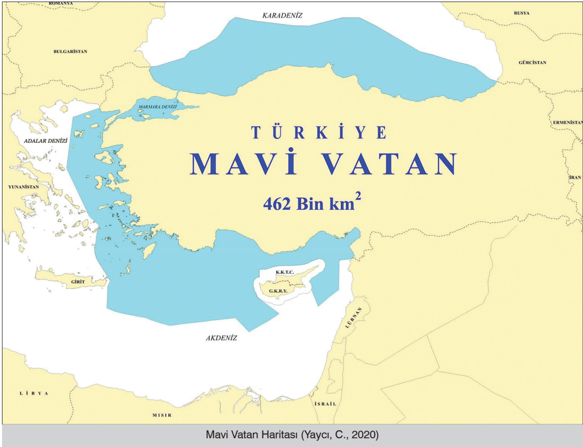
Mavi Vatan Haritası (Yaycı, C., 2020)

Üçüncüsü, bu harita Türkiye'nin açık denizlere ulaşma hakkını engellemektedir. Yukarıda da bahsettiğimiz gibi Uluslararası Deniz Hukuku'na göre denize kıyısı olan ülkelerin açık denizlere ulaşma hakkı engellenemez. Sevilla Haritası ve Yunanistan tezleri ise Türkiye'yi Antalya ve İskenderun limanlarına hapsedmekte ve açık denizlere ulaşmasını engellemektedir (Türkeş, 2021, p. 99).