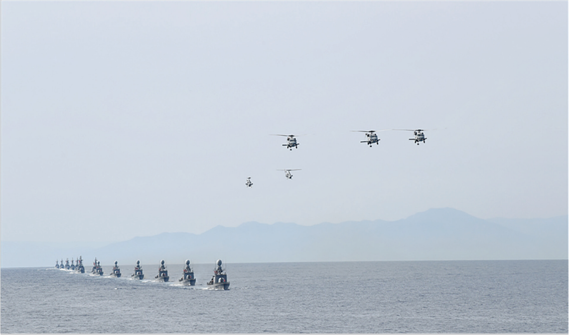
Türkiye Cumhuriyeti Deniz Kuvvetleri Komutanlığı'nın 2022 Mavi Vatan tatbikatı. (Deniz Kuvvetleri Komutanlığı, 2022)

Diğer önemli unsur ise korkudur. BGKT eski ve yeni yaklaşımlarda olduğu gibi ilk olarak coğrafya vurgusu yapar. Yakın coğrafyadaki komşu devletlerin sahip oldukları güç ve tehdit oluşturma potansiyeli uzak coğrafyalara kıyasla yakın coğrafyalarda daha büyük etkiye sahiptir. Devletler, komşusu olan diğer devletlerin niyetlerinden ve potansiyel güçlerinden korkarlar. Bu nedenle güvenlik analizleri genelde bölgesel düzeyde yapılmaktadır (Buzan & Waever, 2003, p. 3). Korku nedeniyle bölgelerdeki devletler birbirine daha çok bağlanır ve devletler arasındaki güvenlik bağımlılığı oldukça yüksektir. Bu nedenle güvenlik sorunlarının daha iyi anlaşılması ve çözüm üretilebilmesi için bölgeyi bir birim olarak analiz etmek gerekmektedir (Buzan & Waever, 2003, p. 41).