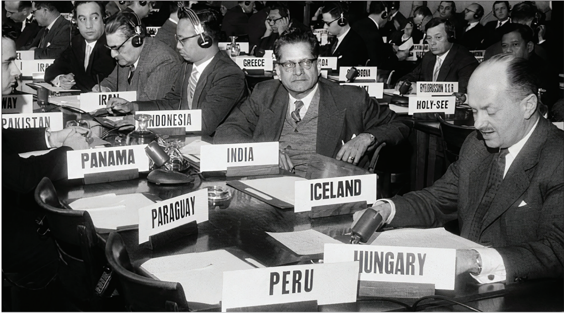
1958 Cenevre Deniz Hukuku Sözleşmesi. (Hukuk Ansiklopedisi, 2019)