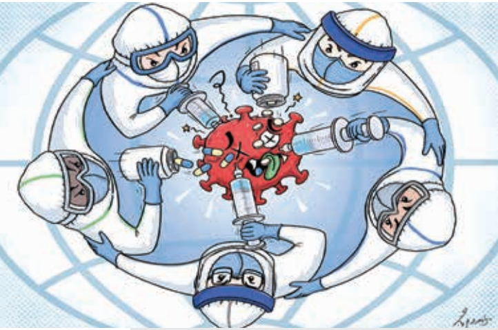
(China Daily, 2020)

Siyasi amaçlarla körüklenen salgın suçlamaları konusunda geçen yüzyılda da dikkate değer örnekler görüldü. 1985 yılında, Sovyet Yazarlar Birliğinin resmi dergisi Literaturnaya Gazeta'da, Edinilmiş Bağışıklık Eksikliği Sendromu'nun (AIDS) Georgia - Atlanta'daki Hastalık Kontrol Merkezleri ile işbirliği içinde, Maryland'deki Fort Detrick Üssü'nde yürütülen bir biyolojik çalışmanın ürünü olduğunu iddia eden makaleler yayımlandı (Elkin & Gilman, 1988: 361; Seale, 1986). Resmi yayın kuruluşu Pravda'nın siyasi karikatürçüsü D. Agaeva, kinayeli bir dille suçlama ve varsayımlara bugün hâlâ örnek teşkil edebilecek imgelerden ilham aldı. Çiziminde uğursuz görümlü bir bilim insanı, AIDS virüsü ile doldurulmuş bir test tüpünü, gamalı haç taşıyan ABD'li bir generale veriyordu. Birçok ölü de toplama kampı kurbanları olarak resmediliyordu (Elkin & Gilman, 1988: 361).