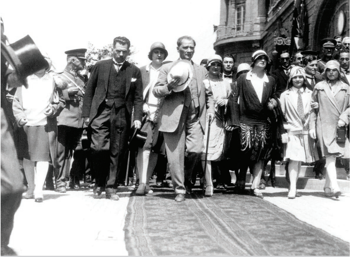
Çinli bilim insanları, Türk ulusal bağımsızlık ve modernizasyon reformlarının başarılı deneyimlerinden ders almayı umuyordu. (Atatürk, Kültür, Dil ve Tarih Yüksel Kurumu web sitesi)

Öncelikle, bağımsızlığa kavuşmak için, Avrupalı güçlerle eşitsiz anlaşmaları fes etmeyi Türkiye’den öğrenmeleri gerekiyordu. “Türkiye, Ulusal Kurtuluş Savaşı ve Lozan Konferansı yoluyla yarı sömürgeci tam bağımsız bir ülke olma yoluna girerken, Çin’in eşitsizlik yaratan anlaşmaları kaldırılmamıştı ve diplomatik dokunulmazlık da tam olarak geri kazanılamamıştı” (s.103). Lozan Konferansı’nda İsmet İnönü’nün mükemmel diplomatik çalışmalarını öven bilim insanları Çin hükümeti ve diplomatların fark yaratmasını bekliyorlardı. “Şimdi Çin’deki büyük güçlerin konsolosluk yetkisinin kaldırılmasını talep etmeye çalışmalıyız ve sorunu çözmek için yeni bir çok taraflı anlaşma imzalamadan önce onları Türkiye gibi tek taraflı olarak kaldırmayı ilan etmeliyiz” (s.163).