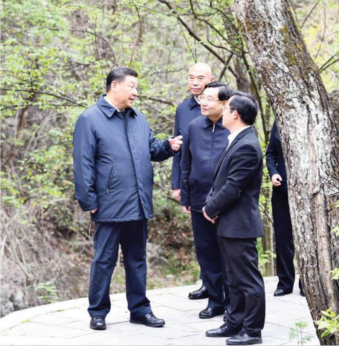
Xi Jinping, Shaanxi Eyaleti, Qinling Dağları'ndaki Niubeiliang Ulusal Doğa Koruma Alanı'nı ziyaret etti. (Xinhua, 2020)

Çin, daha etkili politikalar ve önlemler alacak, 2030'dan önce karbondioksit salımlarını en yüksek düzeye çıkaracak ve 2060'tan önce karbon nötr hedefini başaracak, böylece Paris Anlaşması'nın hedeflerine ulaşmak için daha fazla çaba ve katkı sağlayacak.