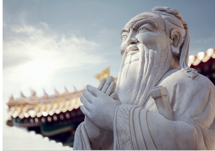
Konfüçyüs Enstitüsü, Çin dilini dünyaya tanıtmaya, Çin kültürünü yayma ve farklı kültürler arasındaki alışverişini geliştirme görevini üstlenir. (CGTN, 2018)

Üçüncüsü, Çin diplomatik ilişkilerde ortaklık-