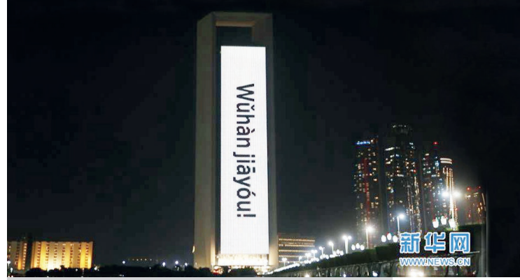
Dünyanın en yüksek binası olan BAE'deki Burj Khalifa'da, “Haydi Wuhan” (Wuhàn jiāyóu!) gibi cesaret verici sloganlar sergilenmiştir. (Xinhua, 2020)

man'ın “2040 Vizyonu” ve diğer ulusal orta ve uzun vadeli kalkınma stratejileri ile büyük ölçüde uyumludur. Bunların hepsi, Arap ülkelerinin muzdarip olduğu, tek bir ekonomik yapı, geçmiş endüstriyel gelişim ve yüksek genç işsizliği gibi konulardaki “yönetim eksikliği” çözüme uygulamalarıdır (Zhang, 2019).