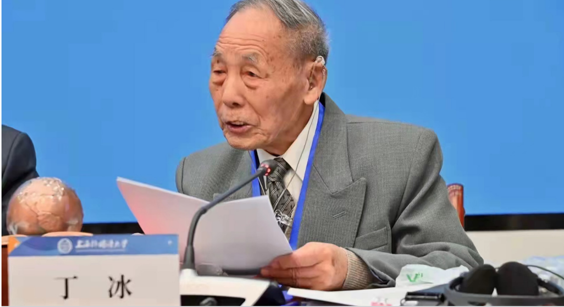
Başkent Ekonomi ve İşletme Üniversitesi'nden Profesör Ding Bing, 2021'de Marksist Ekonomi Ödülü'nü kazandı. (Başkent Ekonomi ve İşletme Üniversitesi'nin internet sitesi, 2021)

beri, aralarında “Ding Bing’in Seçme Eserleri”nin de olduğu 15 bireysel bağımsız monografi, ortak yazar, baş editör veya baş editör yardımcısı olduğum toplam 104 eser ve 260 önemli akademik makale ve çeviri yayınladım. Bunların arasında yaklaşık 4 milyon kelime tarafımdan yazılmıştır.