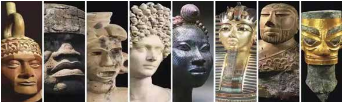
Farklı kültürlerden günümüze ulaşan özgün figürler