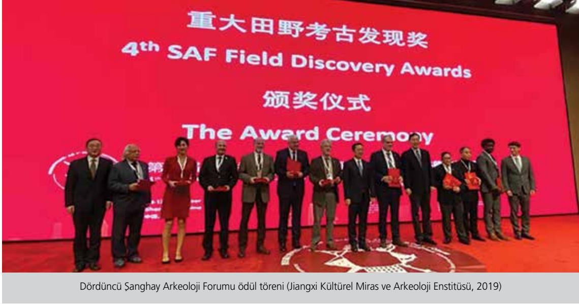
Dördüncü Şanghay Arkeoloji Forumu ödül töreni (Jiangxi Kültürel Miras ve Arkeoloji Enstitüsü, 2019)

buraya gelmesi gerekli. Bu kadar büyük bir kongre çevrim içi olmaz. Bu sene çevrim içi olarak Kopenhag'ta "Yakın Doğu Avrupa Neolitiği Kongresi" oldu, birkaç yüz bildiri vardı ama yine de çevrim içi sadece yapılmış olmak için yapıldı.