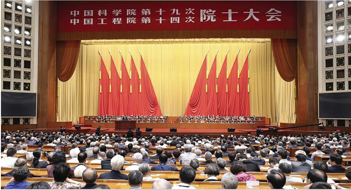
Çin Bilimler Akademisi 19. Toplantısı ve Çin Mühendislik Akademisi 14. Toplantısı'nın açılışı 28 Mayıs 2018'de Çin'in başkenti Pekin'deki Büyük Halk Salonu'nda yapıldı. (Xinhua, 2018)

COVID-19 salgını sırasında, tüm elektronik aksamın önemli bir bileşeni olan yarı iletken çiplere olan talep, büyük tedarik kesintilerinden etkilenmişti. Ancak ortaya çıkan kıtlıklar, büyük ölçüde Trump yönetiminin Çin ile 2018 ticaret ve teknoloji savaşının doğrudan bir sonucuydu (Brown, 2021).