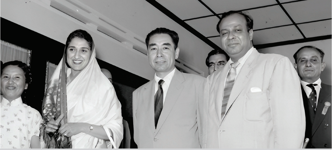
İlk kez dönemin Çin Başbakanı Zhou Enlai tarafından formüle edilen, daha sonra Bağlantısızlar Hareketi tarafından benimsenen “Barış İçinde Bir Arada Yaşamın Beş İlkesi”, bugünün dünyasının özlemlerini dile getiriyor. Bandung Konferansı sırasında Zhou Enlai (ortada) ve Pakistan Başbakanı Muhammed Ali (sağda) ve eşi (solda).