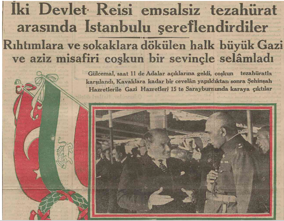
İran Şahı Rıza Pehlevi'nin Türkiye ziyaretinde Mustafa Kemal Atatürk ile yaptığı bir sohbet karesi (Cumhuriyet Gazetesi, 1934).

1928'de kapitülasyonları kaldıran Şah içeride ulemanın muhalefeti sindirdi.