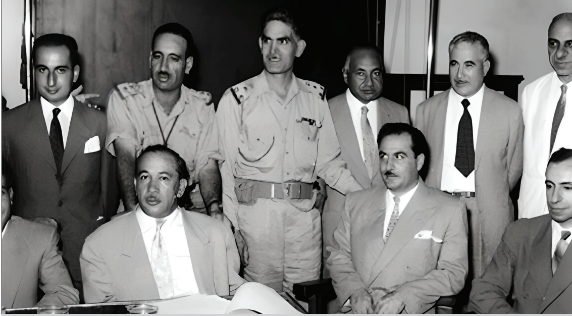
Baasçılık fikrinin ve Baas Siyasal Hareketi'nin fikir babası, sosyolog Mişel Eflak ( n sıra sađdan birinci) Irak'ta 14 Temmuz 1958 ihtilali  yeleri ile birlikte (TRT, 2020).

çođunda  rg tlenmeye giden, Mişel Eflak'ın 1951'de hazırladıđı BAAS partisinin t z đ , Arap toplumlarına yeni ufuklar a tı. Parti'nin laikliđe  zel  nem vermesinin nedeni, s m rgeciliđe karşı ulusun direnişini artırmak kaygısıydı. Fransızlar ayrı ayrı dinsel se men grupları oluřturarak yeni sorunların tohumlarını ektiler, M sl manlar, Rum Katolikler ve Ortodokslar, Yahudiler kendi dinsel gruplarına oy vermeye zorlandılar (Nehru, 2016:805).