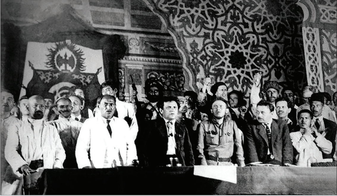
Nerimanov: 'Paşam, gardaş gardaşa borç vermez, el tutar.' Bakü Doğu Halkları Kongresi. Kürsüde (soldan ikinci) N. Nerimanov, G. Zinoviev, K. Radek. Bakü, Eylül 1920.