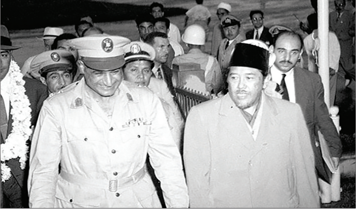
1956-1970 yıllarında Mısır'ın ikinci cumhurbaşkanı olarak görev yapan Cemal Abdülnasır Hüseyin (solda), 1955 yılında Bağlantısızlar Hareketi'nin kurulduğu Bandung Konferansı'nda.

1878 Berlin Kongresi'nde Osmanlıya verdikleri desteğin bedeli olarak Mısır'a ve Kıbrıs'a sözde geçici olarak el koydular. I. Dünya Savaşında Mısır'ı bölgedeki çatışmalarda ana üs olarak kullandılar.