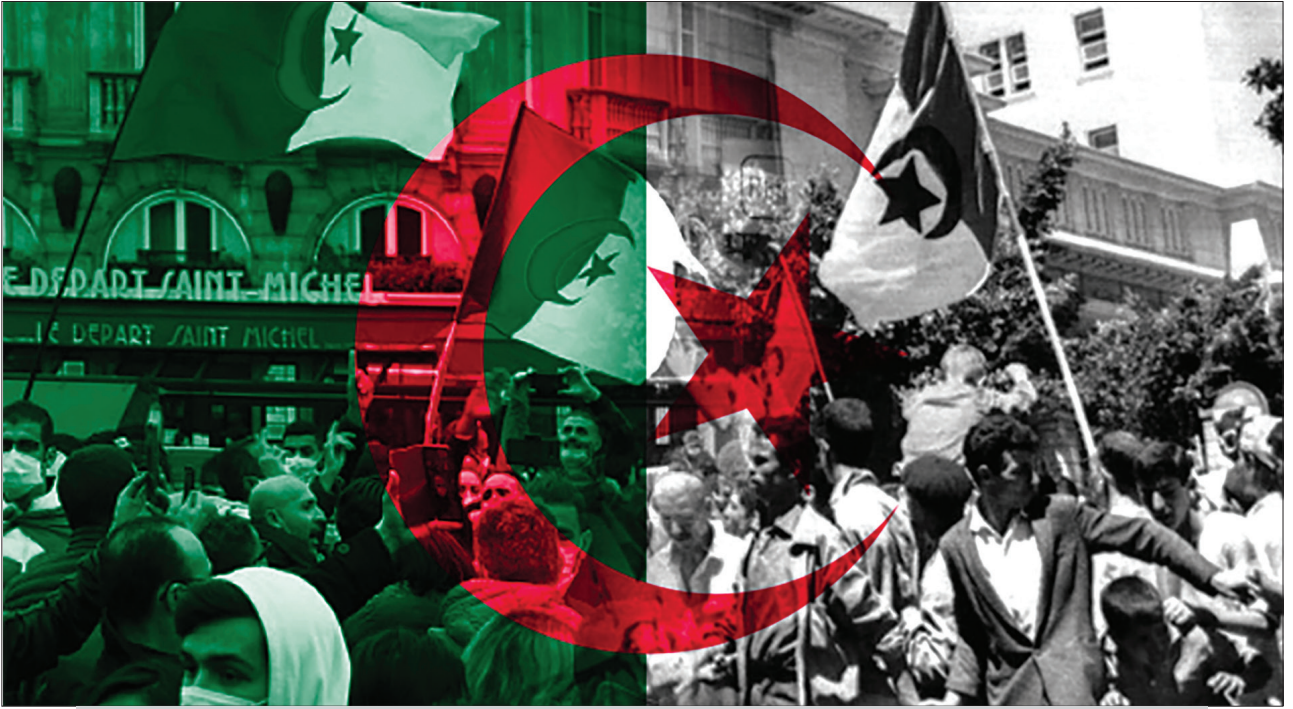
Cezayir’de uluslařma m cadelesinin esas esin kaynađının T rk Devrimi olduđunu, y zeyssel bir arařtırma bile ortaya koyuyor (United World, 2022).

Adama yani Osmanlı Devleti’ne karřı harekete getiler. Ardından T rk milli m cadelesi bařladı. Telemse’nde o sırada her k şede T rkiye’nin tartıřıldıđını belirten Mesali El Hac, Anadolu’dan gelen zafer haberlerini aldıđında yařadıđı mutluluđu řu s zlerle anlatır: