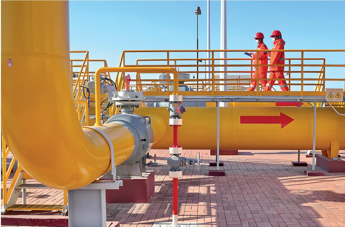
Kasım 2022, Çin’in kuzeyindeki Hebei Eyaleti, Qinhuangdao’daki Çin-Rusya doğu rotası doğal gaz boru hattında denetim çalışmaları yapılırken.

ne gelmiş ve dünya için bir “gelişim kuşağı” ve tüm ülkelerin insanları için bir “mutluluk yolu” olarak övülmüştür. Ancak, Kuşak ve Yol’u teşvik sürecinde, Soğuk Savaş zihniyetinin doğurduğu zorluklarla da karşılaşmıştır. Bu zihniyet, Çin’in “kendi etki alanlarını yaratmak” ve “hegemonya aramak” şüpheleriyle hedef haline gelmesine ve ekonomik ve ideolojik çatışmaların kışkırtılmasına yol açmıştır. Xi Jinping “dünyanın, hızlanan evrimsel bir ivmeyle yüzyıllık değişimlerin ortasında” olduğunu ve Kuşak ve Yol’un birlikte inşası için uluslararası ortamın giderek karmaşıklaştığını belirtmiştir. Xi Jinping, görüşlerini şu şekilde devam ettirmiştir: “Stratejik kararlılığımızı korumamız ve zorluklara etkin olarak yanıt vermemiz gerekiyor.” 2023’te 3. Kuşak ve Yol Uluslararası İşbirliği Zirve Forumu’nda Xi