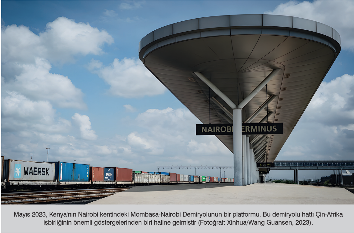
Mayıs 2023, Kenya'nın Nairobi kentindeki Mombasa-Nairobi Demiryolunun bir platformu. Bu demiryolu hattı Çin-Afrika işbirliğinin önemli göstergelerinden biri haline gelmiştir.

milyar Amerikan dolarını açacak ve Çin'in dışı doğrudan yatırımları 240 milyar Amerikan dolarını geçecektir. KYG, Rusya'nın Avrasya Ekonomik Birliği, Kazakistan'ın Parlak Yolu, Türkmenistan'ın İpek Yolu'nun Canlandırılması, Moğolistan'ın İpek Yolu ve Avrasya Ekonomik Birliği ile birleşmiştir. Hindistan ve Rusya gibi Çin'in komşu ülkeleri, Kuşak ve Yol inşasının odak noktasını oluşturmaktadır. Güney Asya'da büyük bir ülke ve Çin'in komşusu olan Hindistan, Kuşak ve Yol'a sadece dirençli bir tutum sergilemekle kalmamış, aynı zamanda Japonya ve ABD ile "Asya-Afrika Büyüme Koridoru"nu öne sürmüştür. "Asya-Afrika Büyüme Koridoru" ve "Hindistan-Avrupa Ekonomik Koridoru", Kuşak ve Yol'a denge sağlamak amacıyla Japonya ve ABD ile birlikte önerilmiştir. Antik medeniyetler, bölgesel güçler ve yeni pazar ülkeleri olan Çin ve Hindistan, Barışçıl Bir Arada Yaşama İlkelerine uymalı, farklılıkları korurken ortak