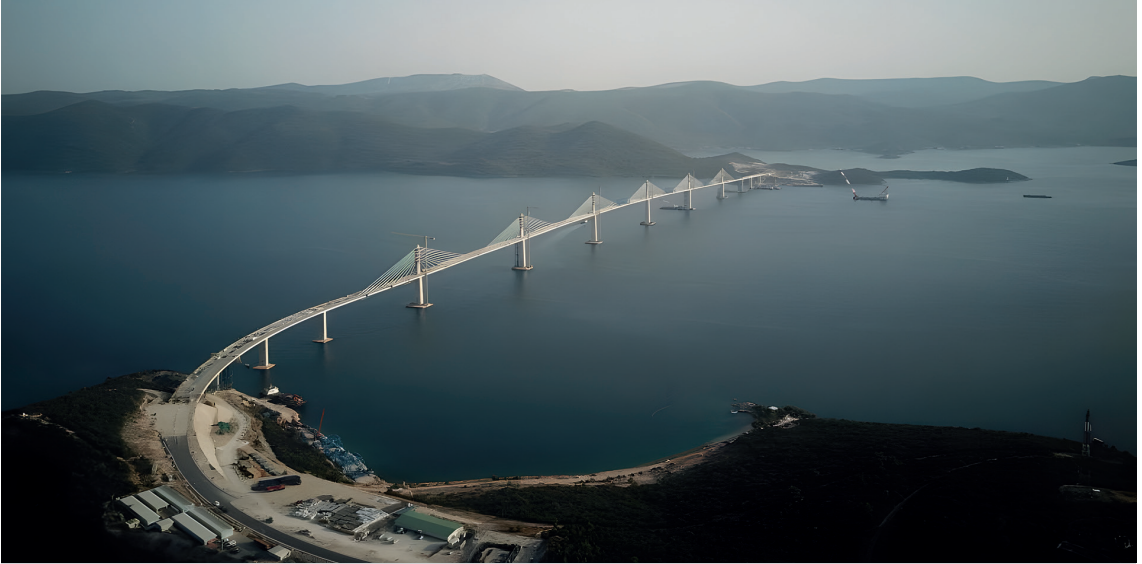
29 Temmuz 2021’de çekilen fotoğraf Hırvatistan’ın güneyindeki Komarna yakınlarındaki Mali Ston Körfezi’nde Kuşak ve Yol Girişimi kapsamında Çin’in inşa ettiği Peljesac Köprüsü’nü gösteriyor. Adriyatik Denizi’ndeki Mali Ston Körfezi üzerindeki 2,4 km’lik köprü, Bosna-Hersek topraklarının kısa bir şeridini atlayarak Hırvatistan anakarasını ve en güneydeki Dubrovnik-Neretva İlçesinin Peljesac Yarımadasını birbirine bağlıyor.

Hindistan Hükümeti, Mayıs 2017’de Güneydoğu Asya, Güney Asya ve Afrika kıtası arasındaki bağlantıyı geliştirmeye odaklanan Asya-Afrika Büyüme Koridoru (AAGC) programını önermiştir. Program, kıtaları bağlayan deniz koridorlarının inşasına vurgu yapar. Programın çevre dostu olmasına ve düşük maliyetli olmasına, aynı zamanda “geniş çapta tanınan uluslararası normlara, iyi yönetime, hukukun üstünlüğüne, açıklığa, şeffaflığa ve eşitliğe” dayanan “karşılaştırmalı avantajına”