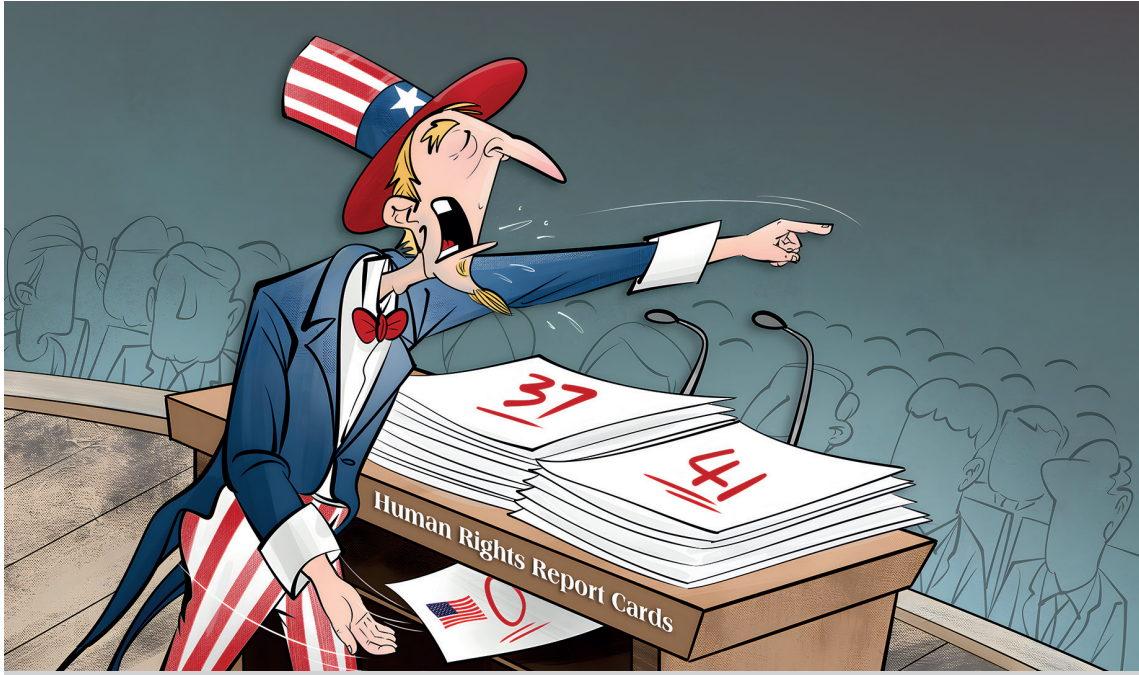
ABD, 'insan hakları' gibi değerler üzerinden Çin'i dengelemek ve müttefikler toplayarak Çin'e baskı uygulamak için daha açık adımlar atmaktadır (Şekil: CGTN, 2023).

olarak görmekte ve “insan hakları” gibi değerler üzerinde Çin'i dengelemek ve müttefikleri toplayarak Çin'e baskı uygulamak için daha açık adımlar atmaktadır. Stratejik rekabet açısından, ABD Kongresi Nisan 2021'de 283 sayfalık Stratejik Rekabetçilik Yasası'nı ve Mart 2022'de Yenilik ve Rekabetçilik Yasası'nı geçirmiştir; “Çin Tehdidi” tezini savunarak Çin ile stratejik rekabeti savunmuş ve Batılı müttefikleri ile birleşerek Kuşak ve Yol'a Soğuk Savaş zihniyetiyle denge siyaseti geliştirmiştir. “ABD'nin Kuşak ve Yol'a yanıtı, müttefikleri birleştirme taktikleri, standartlar anlaşmazlığının içeriği ve saldırı ve itibarsızlaştırma eylemleriyle çok katmanlı bir strateji kullanmaktadır, ancak 'müdahale' veya 'işbirliği' işareti yoktur.” Bu bağlamda zorluklara yanıt vermek ve çatışmaları etkili bir şekilde çözmek için Çin, güçlü rakiplerden çekinme-