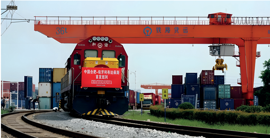
Macaristan Budapeşte'ye giden bir Çin-Avrupa yük treni, 29 Temmuz 2022'de doğu Çin'in Anhui Eyaleti, Hefei'deki bir lojistik üssünden ayrılıyor (Fotoğraf: Xi Jingyu/Xinhua, 2022).

şından sonra Batı Avrupa ülkelerini yeniden inşa etmek ve ekonomik yardım sağlamak için oluşturduğu bir plandı. ABD, bu planın uygulanması yoluyla Batı Avrupa ülkeleri üzerindeki kontrolünü güçlendirerek plandan en fazla faydalanan oyuncu oldu. oldu (Gürcan, 2022). Peterson Institute for International Economics, RAND Corporation ve diğer düşünce kuruluşları Kuşak ve Yol'u Marshall Planı ile karşılaştırarak, Çin'in geçmişte ABD'nin yaptığı gibi ekonomik gücünü jeopolitik etkiye dönüştürmeyi ve kendi iradesine göre "dünyada en etkili güç haline gelmeyi" hedeflediğini savunmuşlardır. Onlar, Çin'in kendi isteklerine göre "uluslararası düzeni yeniden şekillendirme" amacı güttüğünü düşünmektedirler (Milton, 2018). The Diplomat'ta yayınlanan bir makaleye göre, Çin'in Yeni İpek Yolu ve ABD'nin Marshall Planı, "yükselen bir küresel gücün, dış politika hedeflerine ulaşmak için ekonomik gücü kullanma girişimleridir" (Tiezzi, 2014). KYG'nin Çin'in Marshall Planı versiyonu olarak veya "coğrafi