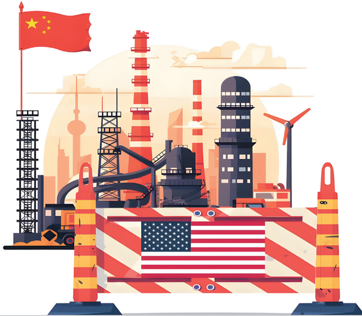
"ABD öncülüğündeki gelişmiş kapitalist ülkeler, ticaret korumacılığına ve ticaret zorbalığına başvurmuş, tek taraflı olarak ticari sürtüşmeler yaratmıştır" (Şekil: Ma Xuejing/China Daily, 2024).

Üçüncüsü, genelleştirilmiş ulusal güvenlik