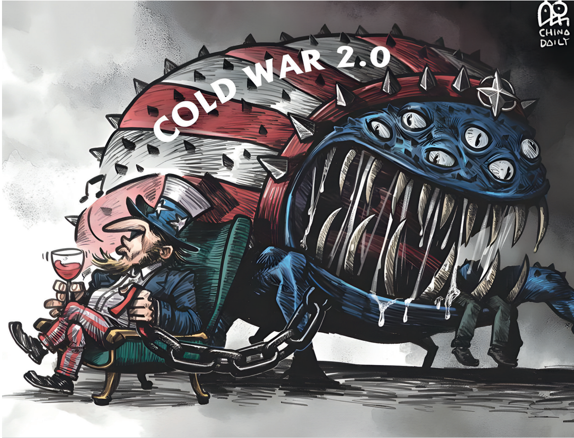
"Son yıllarda, 'medeniyetler çatışması teorisi', 'Çin tehdidi teorisi', 'Çin'i kapsamlı olarak çevreleme teorisi' gibi gerekçelerden ilham alan Soğuk Savaş zihniyeti ve kamplar arası çatışma yeniden canlanmıştır" (Şekil: Cai Meng/China Daily, 2022).

Soğuk Savaş'ın hala var olup olmadığı tartışmasından bağımsız olarak, Soğuk Savaş zihniyetinin bugün hala mevcut olduğu söylenebilir. SB'deki dramatik değişikliklerden sonra, bazı Batılı politikacılar ve stratejistler, dünyayı manipüle ederek hegemonyalarını sürdürme alışkanlıklarını devam ettirmişlerdir, ancak bu durum, dünya ekonomisinin barışçıl gelişimine olumsuz etki yapmıştır. "Soğuk Savaş zihniyeti" terimi, ilk kez Japon-Amerikan dilbilimci ve politikacı Samuel Hayakawa (S.I. Hayakawa) tarafından 1964'te General Semantics And The Cold