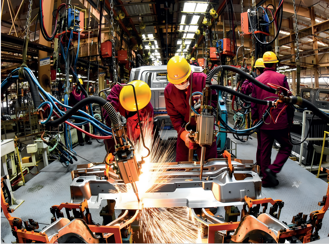
Çin’in doğusundaki Shandong Eyaleti, Qingzhou Şehrindeki bir otomobil imalat atölyesinde işçiler kaynak yapıyor. Başlangıçta Batılı, kapitalist tarzda sanayi ithal eden Çin, bugün tüm ulusal ekonomiler arasında, özellikle ABD’ye kıyasla, endüstriyel emeğin en yüksek oranına sahiptir.

Çin Halk Cumhuriyeti, yabancı kaynakların sömürülmesi, fakir ülkelerin düşük ücretli emek rezervlerinin kullanımı veya Batı’nın “kalkınma yardımı” yoluyla yükselmedi. Hem ulusal hem de uluslararası düzlemde, Çin’in kalkınması emperyalizme karşı bir mantık üzerinde ilerledi. Çin, kendi zorlu çabalarıyla ve dışı açık ancak egemen bir devlet yapısı altında kendi üretim zincirlerini tesis ederek yükseldi.