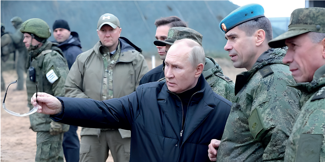
Rusya Devlet Başkanı Vladimir Putin, 20 Ekim 2022'de Ryazan bölgesindeki Batı Askeri Bölgesi eğitim sahasını ziyaret ederken.

15 Haziran 2024'te The New York Times gazetesinde Kiev ile Moskova arasındaki müzakereler sırasında hazırlanan 17 sayfalık "Ukrayna'nın Kalıcı Tarafsızlığı ve Güvenliğine İlişkin Garantiler Antlaşması" taslağı yayınlanmıştır (NYT, 2024a). Kiev ile Moskova arasındaki müzakereler sırasında hazırlanan bu taslak, müzakereciler ve onlara yakın kişiler tarafından doğrulandı. Belgede, Ukrayna kalıcı tarafsızlığı kabul ederse, yine de AB'ye katılabileceği belirtildi. Anlaşmanın garantörleri arasında, Ukrayna'ya güvenlik ve tarafsızlık garantisi verecek olan Rusya da dahil olmak üzere BM Güvenlik Konseyi'nin beş daimi üyesi yer alacak.