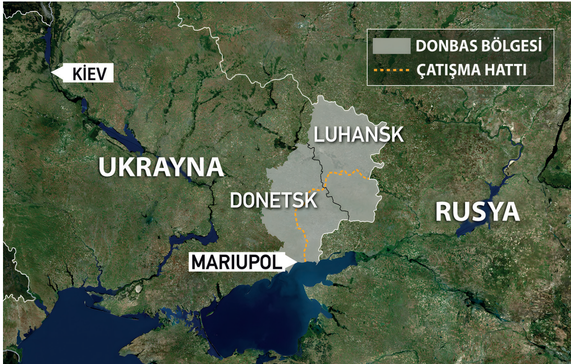
Rusya-Ukrayna Savaşı'nda çatışma hattı ve Donbas Bölgesini gösteren harita (Şekil: CGTN, 2022).

Yaygın bir mit, 24 Şubat 2022'de Rusya'nın aniden Ukrayna'ya saldırması ve topraklarını ele geçirmek için nedensiz bir savaş başlatmasıdır. Bununla birlikte, herhangi bir çatışma gibi, Rus-Ukrayna çatışması da köklü tarihsel, etik ve jeopolitik boyutlara sahiptir. Sovyet Sosyalist Cumhuriyetler Birliği'nin (SSCB) çöküşünden sonra, Mihail Gorbaçov ile Başkan Bush Sr. arasında ABD Ulusal Güvenlik Arşivi'nde belgelenmiş ve mevcut olan net bir anlaşma yapıldı. Bu anlaşma, Amerikan Başkanından, Moskova Almanya'nın yeniden birleşmesine ve NATO'ya katılmasına izin verirse, Kuzey Atlantik İttifakının "bir santim doğuya Rusya'ya doğru hareket etmeyeceğine" dair kesin bir vaadi içermektedir (Nsarchieve, 2017).