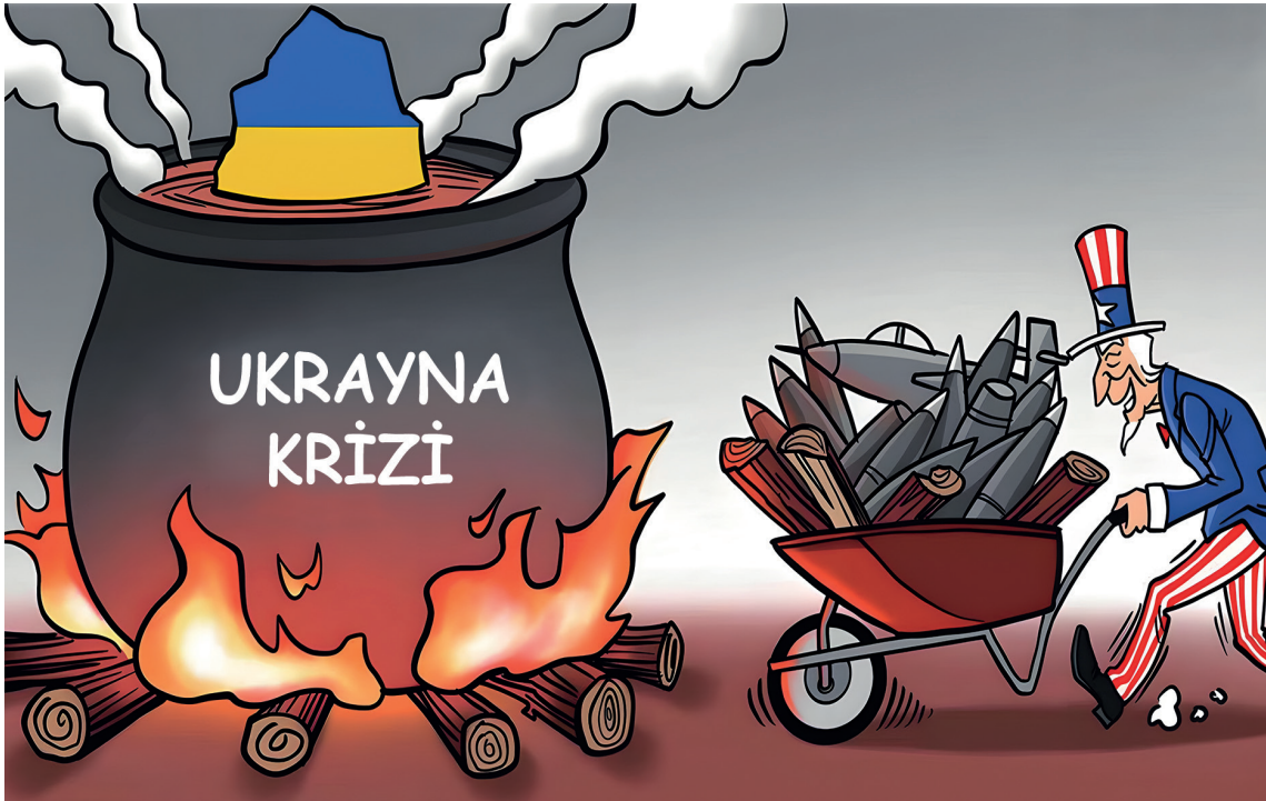
2020 yılına kadar ABD, Lviv yakınlarındaki eğitim merkezinde yılda beş Ukrayna Silahlı Kuvvetleri taburunu eğitmişti. (Şekil: Liu Rui/GT, 2023).

Savaş başlamadan önce, 18 Kasım 2021’de Vladimir Putin, Rusya Dışişleri Bakanlığı’nda yaptığı konuşmada, Rusya’nın NATO’nun doğuya doğru genişlemesini ve komşu devletlere saldırı silahlarının konuşlandırılmasını önlemek için güvenilir yasal güvencelere ihtiyacı olduğunu vurguladı.