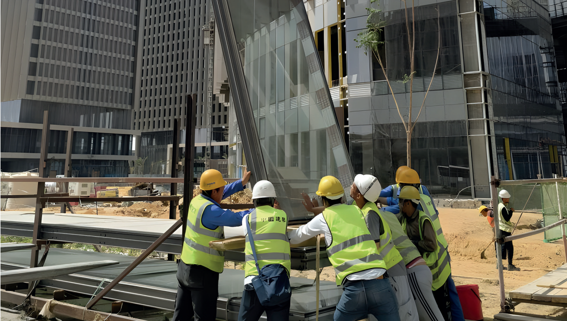
Çinli ve Mısırlı işçiler, yalnızca Kuşak ve Yol Girişimi'nin önemli bir projesi değil, aynı zamanda Çinli şirketlerin Mısır'da inşa ettiği en büyük proje olan yeni başkent inşasında birlikte çalışıyor.

Çin ve Ortadoğu ülkeleri arasındaki kalkınma işbirliğinin pragmatik yörüngesini ağırlıklı olarak birkaç temel unsur göstermektedir. Çin, bu ülkelere giderek artan bir şekilde kalkınma yardımı sunmakta, çatışma sonrası bölgelerde yeniden inşayı kolaylaştırmakta ve yoksulluk, işsizlik, su kaynakları yönetimi ve temel geçim güvenliği gibi önemli zorluklarla başa çıkmaktadır. İkincisi, Çin, altyapı geliştirme, ekonomik planlamada en iyi uygulamaların yayılması, yabancı yatırımların çekilmesi ve özel ekonomik bölgelerin kurulması gibi konularda aktif katılım yoluyla bölge ülkelerini güçlendirmek için kalkınma yardımlarını artırmayı hedeflemektedir. Bu strateji, bu ülkelerin kalkınma yeteneklerini artırmayı amaçlamaktadır. Üçüncü olarak, Pekin yeni enerji ve gelişen teknolojilerde karşılıklı faydalı işbirliğini teşvik etmeyi amaçlamaktadır. Ortadoğu'ya yeni altyapılar kurma ve yenilikçi sanayileşmeyi teşvik etme konusunda yardımcı olmakta, böylece bölge ülkelerinin değişim ve gelişimini kolaylaştırmaktadır.