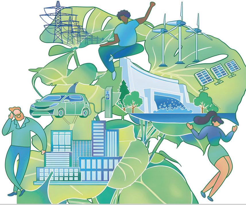
Küresel Kalkınma Girişimi, insan odaklı bir yaklaşım benimseyerek doğa ile insan arasında uyum sağlamayı ve ortak kalkınmayı teşvik etmeyi amaçlamakta ve kalkınma sorunlarına yeni çözümler sunmaktadır (Çizim: China Daily, 2024)

sektörleri sürdürülebilir yeşil büyüme hedeflerini daha geniş kalkınma planlarına entegre etmek üzere harekete geçirebilecek yüksek düzeyde bir koordinasyon mekanizmasının kurulmasını gerektirir. Ayrıca, mevcut politikaların etkinliğini değerlendirmek için yeşil büyümenin ilerlemesini izlemek ve değerlendirmek, her aşamada tüm paydaşların katılımını sağlamak için kurumsal mekanizmalar oluşturmak, karbonsuzlaşma için elverişli bir ortam yaratmak amacıyla kamu-özel ortaklıklarını teşvik etmek ve yeni ve yeşil teknolojilerin yatırımını ve kullanımını desteklemek de dahil edilmiştir. Ayrıca, toplumdaki savunmasız grupların ihtiyaçlarını karşılamak, kimse geride kalmamasını sağlamak için çok önemlidir (UNESCWA, 2022).