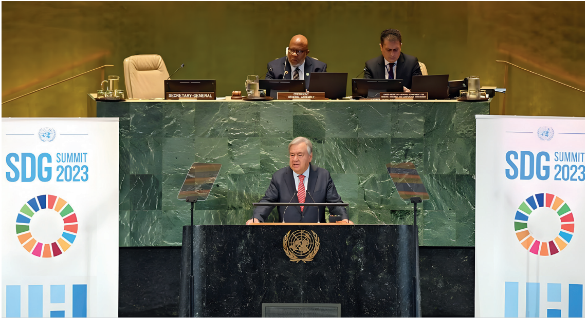
BM Genel Sekreteri Antonio Guterres, KKG'nin 2030 Sürdürülebilir Kalkınma Gündemi'ni ilerletmedeki, küresel eşitliği artırmadaki ve adil sürdürülebilir kalkınmayı kolaylaştırmadaki önemini vurgulamıştır.