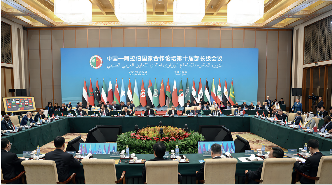
Arap ülkelerinin temsilcileri, 30 Mayıs 2024'te Pekin'de düzenlenen Çin-Arap Devletleri İşbirliği Forumu'nun 10. Bakanlar Konferansı'nın açılış törenine katıldı.

tim kapasitesini artırma konusunda yardım etmeyi taahhüt etti. Bu, modern tarım için beş işbirliği laboratuvarının kurulmasını, tarımsal teknik işbirliği için 50 girişimin gerçekleştirilmesini ve bölgesel ülkelere gıda üretimini artırma, depolama yeteneklerini geliştirme ve tarımsal verimliliği iyileştirme konularında yardımcı olmak üzere 500 tarımsal teknik uzmanının görevlendirilmesini kapsamaktadır. Ayrıca, Arap ülkelerinden yüksek kaliteli tarım ürünlerinin ithalatını kolaylaştırmak için bir "yeşil kanal" oluşturulacaktır.