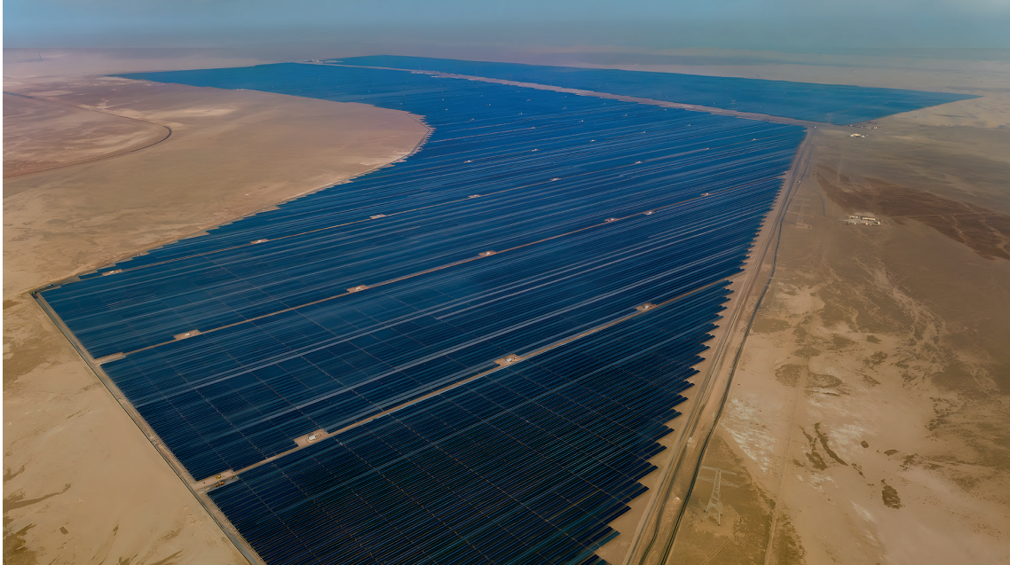
Birleşik Arap Emirlikleri'nde Çinli bir şirket tarafından yapılan Al Dhafra PV2 Güneş Enerjisi Santrali Kasım 2023'te tamamlandı.

8 trilyon doları aşan ürünleri ithal etme ve küresel yabancı yatırımlar için 750 milyar dolardan fazla tahsis etme niyetini açıkladı. Ayrıca, sanayinin canlandırılmasına odaklanan ekonomik rehabilitasyon için özel bir girişim başlattı ve finansal işbirliği için 3 milyar dolar tahsis edilen bir Çin-Arap Ülkeleri Bankacılık Konsorsiyumu oluşturdu (CASCF, 2018). Yetkililerin açıklamalarına göre, Çin, Ortadoğu'nun sanayileşmesini kolaylaştırmak için özel ve indirimli krediler kullanmaya devam edecek, Çinli firmaların sanayi parklarının geliştirilmesi ve inşası, yatırım operasyonları ve sanayi kümeleri konularında katılımını teşvik edecek. 2020 yılında yapılan 9. CASCF Bakanlar Toplantısı, Amman Deklarasyonu ve 2020-2022 uygulama planını onaylayarak, Çin ile Arap devletleri arasındaki stratejik ilişkiyi güçlendirmeyi ve yeni çağda ortak bir geleceğe sahip Çin-Arap topluluğu kurmayı taahhüt etti. Pekin, Kuşak ve Yol Girişimi kapsamında 22 Arap ülkesi ve Arap Birliği ile işbirliği anlaşmaları imzaladı.