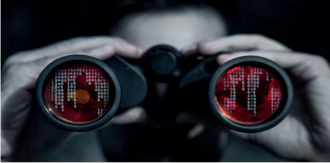
"İstihbarat, günümüzdeki karmaşık güvenlik ortamında devletlerin stratejik kararlarını belirlemede ve ulusal güvenliklerini sağlamada kritik bir unsur olarak öne çıkmaktadır".

bu bağlamda devletler, ulusal çıkarlarını koruma amacıyla hareket etmektedirler (Karabulut, 2015). Devletler arası ilişkilerde güvensizlik ortamının hüküm sürdüğü anarşik bir sistemde, her devlet kendi güvenliğinden sorumlu olup, diğer devletlerin tehditlerinden korunmak adına stratejik kararlar almaktadır.