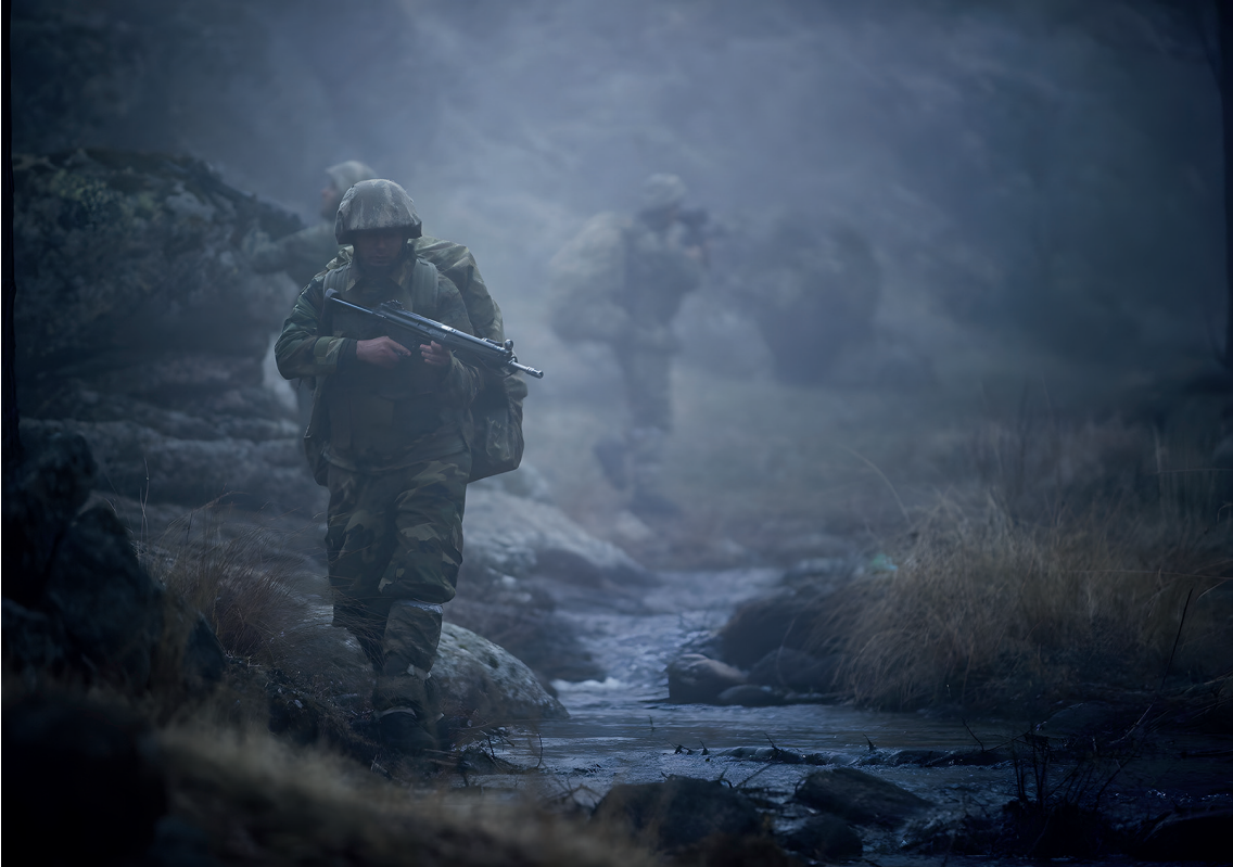
“Terör örgütlerine karşı askeri operasyonlar devletlerin güvenlik politikasında önemli bir yere sahiptir”.

Realist teorinin güvenlik ve güç dengesine dayalı yaklaşımında istihbarat, devletlerin ulusal güvenliklerini sağlama ve uluslararası sistemdeki güç dengelerini yönetme süreçlerinde vazgeçilmez bir unsur olarak karşımıza çıkmaktadır. Devletler, istihbarat yoluyla rakiplerinin askeri kapasitelerini ve politik hamlelerini öngörmekte, güvenlik stratejilerini bu bilgiler doğrultusunda şekillendirmekte ve ulusal çıkarlarını koruma çabasına girmektedirler. Bu nedenle, realist teori kapsamında istihbarat, uluslararası arenada güvenliği sağlama ve güç dengesini kurma süreçlerinin temel bir bileşeni olarak değerlendirilmektedir (Kolasi, 2014).