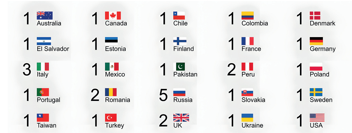
Şekil 3. 2022'de Askeriye ve Savunma Sanayiine Yönelik Siber Saldırıları (ülkelere göre sayılar)

Siber tehditler, sadece devletlerin askeri ve siyasi yapılarına yönelik değil, aynı zamanda ekonomik sistemlerine de ciddi zararlar verebilmektedir (Şekil: KonBriefing, 2024).