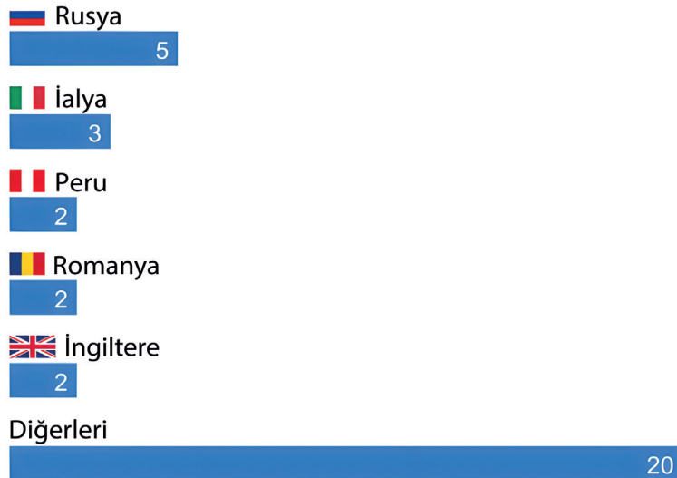
Şekil 2. 2022'de Askeriye ve Savunma Sanayiine Yönelik Siber Saldırıları

"Siber güvenlik, günümüzde ulusal güvenlik politikalarının merkezi bir bileşeni haline gelmiştir" (Şekil: KonBriefing, 2024).